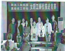
(校领导与获奖选手合影。摄影:高雅明)

9月25日,我校在二楼会议室开展了女职工岗位描述竞赛活动。上午10点来自不同专业、不分年龄的24名女工,从自我介绍、工作目标、工作内容、个人工作情况方面尽情展示个人风采。